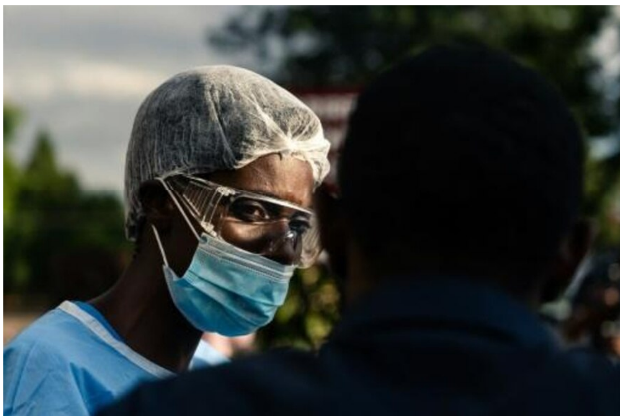
▲ Un miembro del personal médico del hospital Parirenyatwa en Harare, el 23 de marzo de 2020

Un espejo donde se mira la Argentina, vendiendo hasta los huesos de la abuela al imperialismo y diciendo que cuida esos recursos, cuando no hace más que ponerle un precio mayor a la entrega que quedará en los bolsillos de la rapaz serie de corruptos de ese país. La corrupción en Zimbabwe es innegable, tanto que medios internacionales se referían a ella como un estorbo en ese país en la lucha contra el Covid-19.