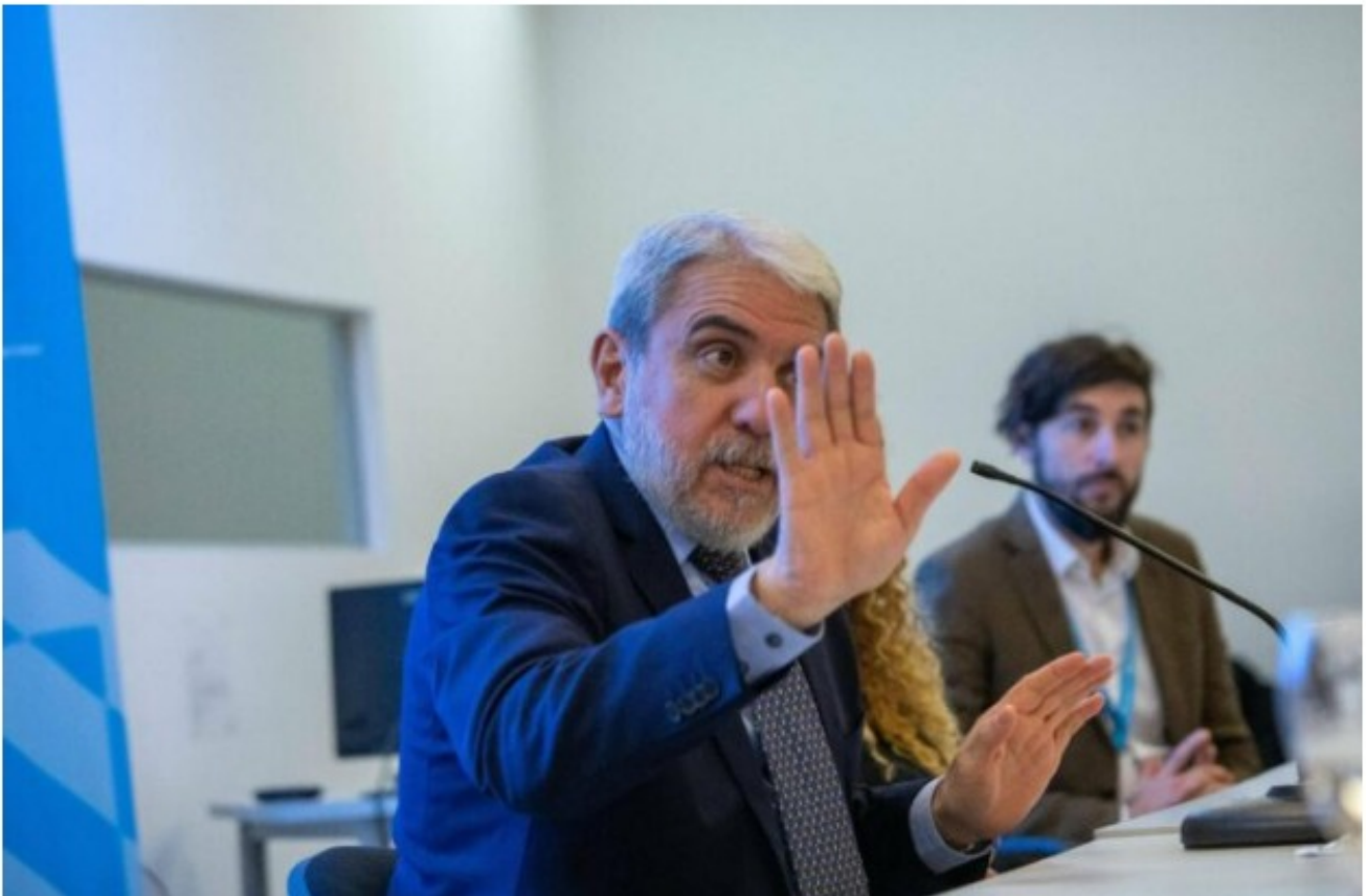
Aníbal Fernández defendió el operativo en Villa Mascardi.

Cuando las teorías de la conspiración universal antiperonista están en todos los medios y espacios de propaganda kirchnerista, el Ministro de Seguridad de la Nación salía con una teoría nueva sobre los motivos del ataque a CFK. En efecto, el Ministro aseguró que el atentado pudo tener como fin una reacción de los mercados y pidió que se investigue en esa línea.