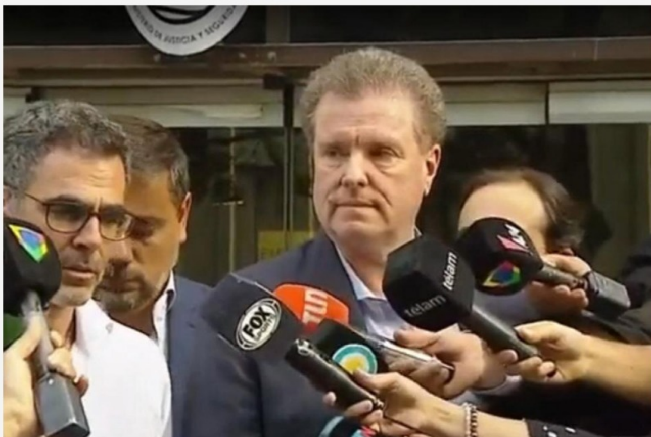
El llamativo proyecto de Gerardo Milman dos semanas antes del atentado contra CFK.

El diputado del PRO pedía informes sobre la custodia de la vicepresidenta, jueces y fiscales de la causa Vialidad. También preguntaba si la AFI actuaría sobre organizaciones políticas y sociales, entre otros.