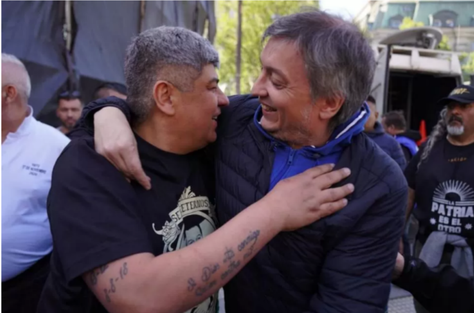
SOCIOS. Pablo Moyano y Máximo Kirchner apoyan al Gobierno pero critican el rumbo económico

En el acto de Plaza de Mayo Moyano se los vió a Máximo Kirchner y Pablo Moyano a los abrazos y a los besos, hubo palos para la CGT y para todo aquel que no se cuadre con ellos. Pablo Moyano hasta se animó a pedir unidad entre Alberto y Cristina de forma airada. El dirigente dijo: “Llegó el momento de que los que tienen verdaderamente el poder se dejen de joder, se junten y empiecen a pensar en serio en el pueblo argentino” . Se quedaron muy calientes los Moyano e hicieron prender de nuevo la máquina de las paritarias para ellos solitos. Nada les alcanza, nunca.