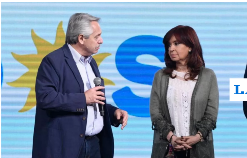
REFERENTES DEL FRENTE DE TODOS. Alberto Fernández y Cristina Kirchner.

Muchos comenzaron a operar mudar el Cabaret de Todos a Tucumán con un encuentro el 17 de octubre entre Cristina y Alberto allí. Pero las batallas no llegaron a ponerse de acuerdo con el cartelazo y la cosa se fue a pique antes de empezar. Las internas irían in crescendo y los alineamientos entre las scuderias en pugna cambiarían drásticamente en cuestión de unos días.