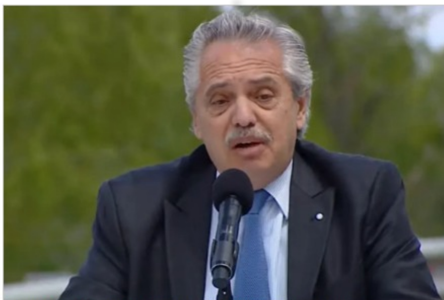
El presidente Alberto Fernández iniciará acciones legales contra el participante de Gran Hermano