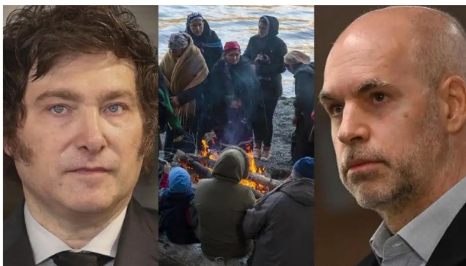
Javier Milei, Mapuches y Horacio Rodríguez Larreta

“¿Estarémos frente a un kirchnerismo mapuche?”, preguntó el diputado libertario en sus redes sociales.