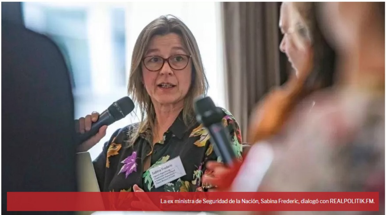
La ex ministra de Seguridad de la Nación, Sabina Frederic, dialogó con REALPOLITIK.FM.

La ex ministra de Seguridad de la Nación y presidenta de la Agencia Argentina de Cooperación Internacional y Asistencia Humanitaria - Cascos Blancos (ACIAH), Sabina Frederic, dialogó con RADIO REALPOLITIK FM ( www.realpolitik.fm ) sobre el conflicto actual en Villa Mascarcardi y la actuación de las fuerzas de seguridad en el lugar.