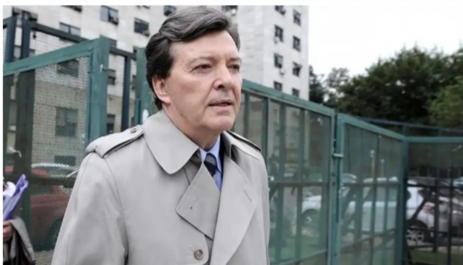
César Milani

El ex jefe del Ejército cuestionó al ministro de Seguridad bonaerense por la represión en el ingreso al estadio de Gimnasia que terminó con un muerto y más de cien heridos. Además, al respecto del conflicto en Villa Mascardi afirmó que "si no alcanza con el diálogo hay que ejercitar la violencia cuando la hay del otro lado".