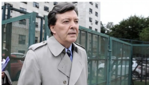
César Milani | TELAM

El ex jefe del Ejército cuestionó al ministro de Seguridad bonaerense por la represión en el ingreso al estadio de Gimnasia que terminó con un muerto y más de cien heridos. Además, al respecto del conflicto en Villa Mascardi afirmó que "si no alcanza con el diálogo hay que ejercitar la violencia cuando la hay del otro lado".