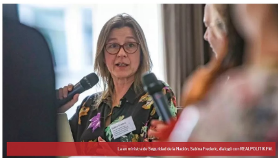
La ex ministra de Seguridad de la Nación, Sabina Frederic, dialogó con REALPOLITIK.FM

La ex ministra de Seguridad de la Nación y presidenta de la Agencia Argentina de Cooperación Internacional y Asistencia Humanitaria - Cascos Blancos (ACIAH), Sabina Frederic, dialogó con RADIO REALPOLITIK FM ( www.realpolitik.fm ) sobre el conflicto actual en Villa Mascardi y la actuación de las fuerzas de seguridad en el lugar.