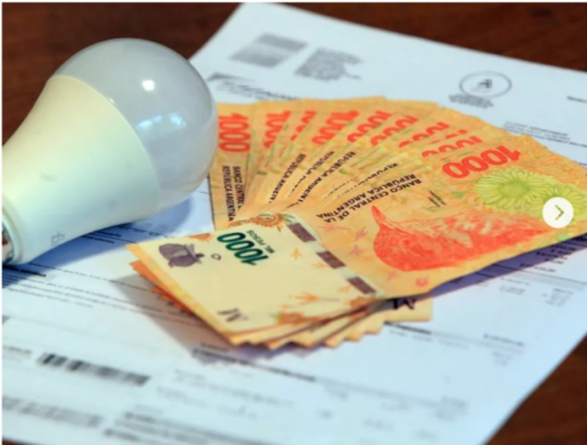
Tarifas de luz y gas: ¿Quiénes no tendrán más subsidios?

Autoridades nacionales detallaron el nuevo esquema de tarifas con quita gradual de subsidios según los niveles de consumo y ubicación geográfica. Cómo será.