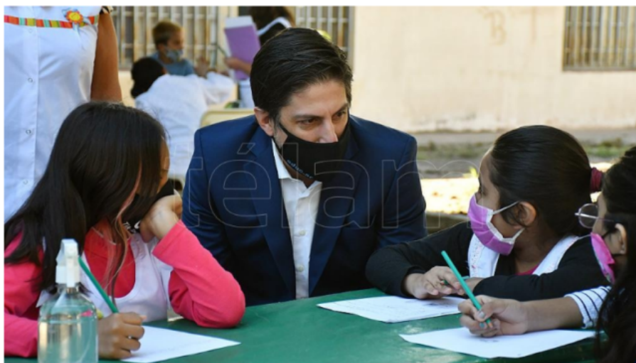
Nicolás Trotta recordó que los protocolos de vuelta a clases se aprobaron el 2 de julio de 2020.

Transitar el ciclo lectivo 2021, luego de un año de presencialidad de los alumnos acotada por la pandemia, implicará "recuperar la centralidad de la agenda educativa" y profundizar el "proceso de reorganización pedagógica" iniciado en 2020, señaló el ministro de Educación, Nicolás Trotta.