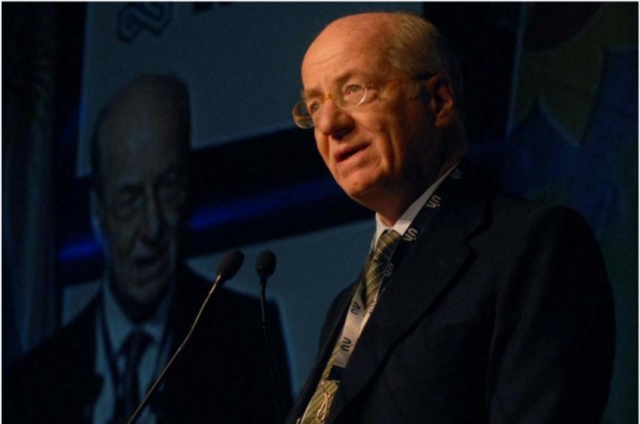
Paolo Rocca, titular del holding.

El holding Techint resolvió despedir a 1450 trabajadores que venían desempeñándose en obras contratadas con el sector privado en las provincias de Buenos Aires, Neuquén y Tucumán. "Son proyectos paralizados en el marco del DNU de la cuarentena", comunicó la empresa, aduciendo que el convenio de la construcción contempla que "si las obras se paralizan, se pueden finalizar los contratos".