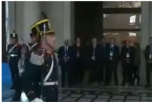
El granadero que dejó en 'bófido' a Macri, con una respuesta que no se esperaba (Foto: captura de video)

El Presidente quiso hacerse el simpático con un granadero que cumplía funciones, pero su respuesta lo incomodó y sólo atinó a reírse. El video.