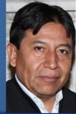
David Choquehuanca Céspedes VICEPRESIDENTE