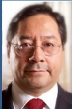
Luis Alberto Arce Catacora PRESIDENTE

FB: Vigilia del Consulado de Bolivia Juana Azurduy Correos: vigiliajuanazurduy@gmail.com comunicacioncontraelgolpe@gmail.com