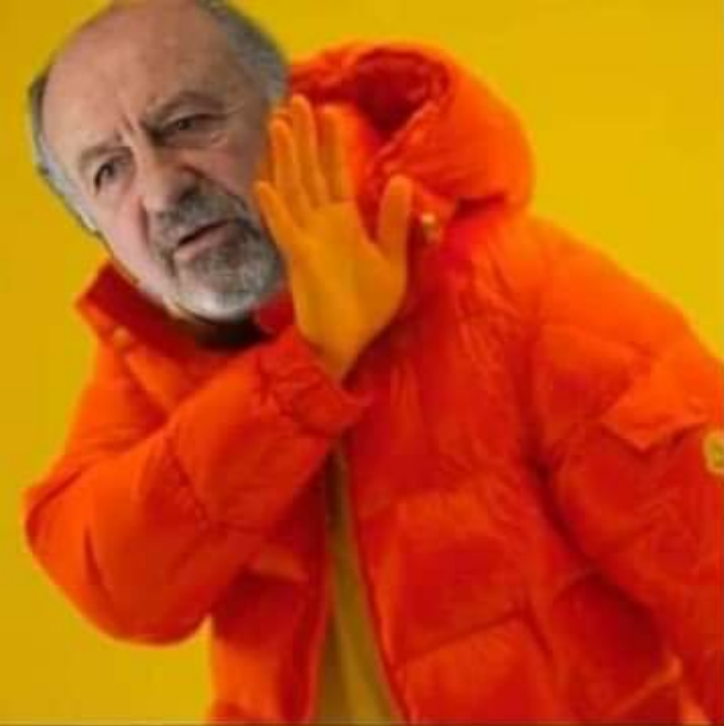
Macri sacando la cláusula gatillo