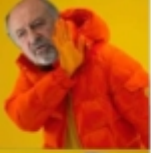
Macri sacando la cláusula gatillo