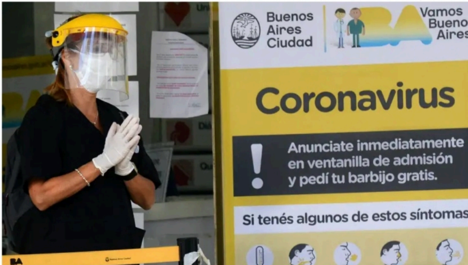
La compra de barbijos en la Ciudad fue denunciada desde la Inspección General de Justicia.

Por el escándalo tuvo que renunciar un funcionario del Gobierno porteño. Para la Justicia no hubo perjuicio para el Estado en el caso revelado por Noticias.