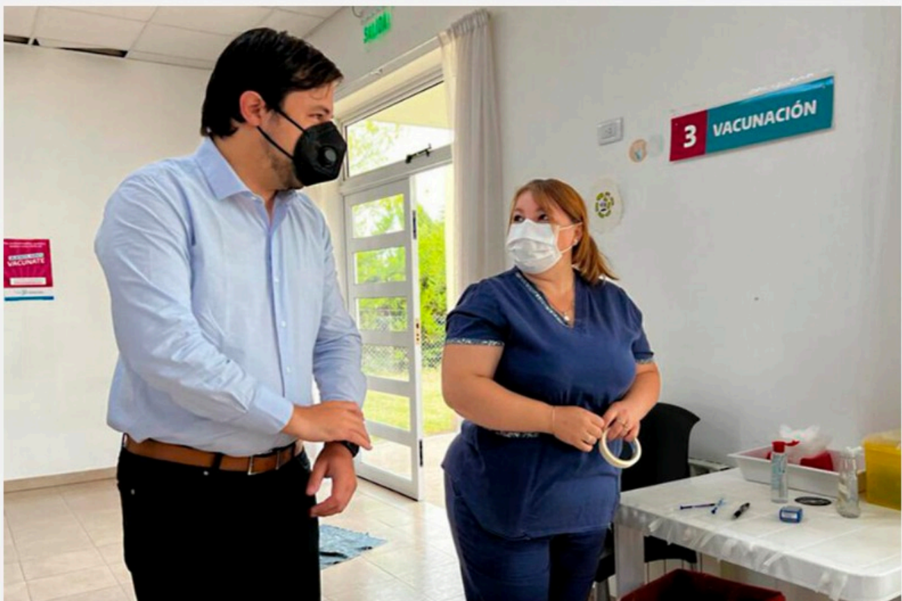
Nicolás Kreplak, ministro de Salud de la provincia de Buenos Aires..

Recomendó usar el barbijo de vuelta en los lugares cerrados y ventilar espacios ante la llegada del invierno.