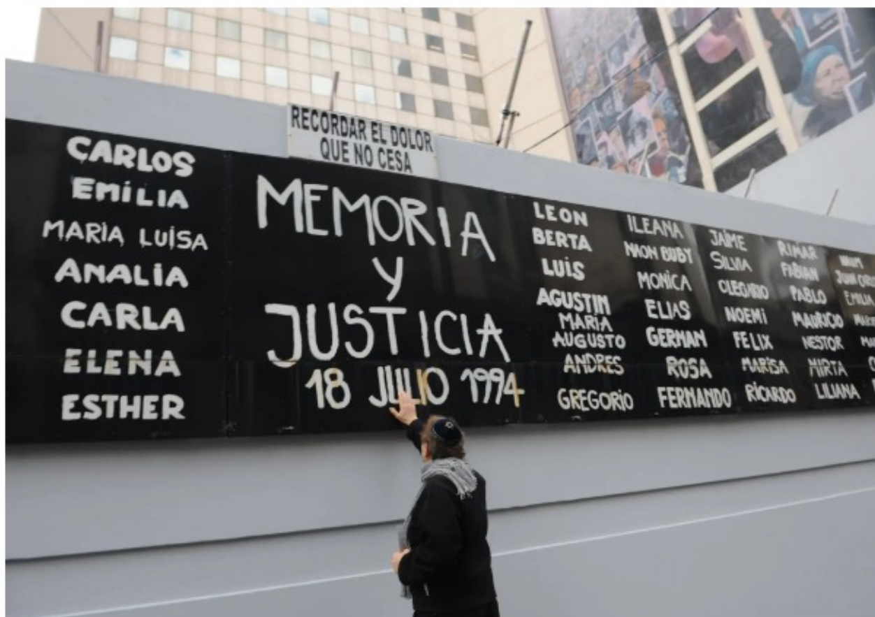
Una valla publicitaria en Buenos Aires con los nombres de las víctimas del atentado de julio de 1994 contra un centro comunitario judío de la ciudad.

Nuevamente, la maquinaria de guerra de El Estado de Israel se burla del Estado argentino tirándole zanahorias a grupos de fanáticos antisemitas que para no pasar por nazis dicen ser "antisionistas". El Mossad emitió un informe en que descarta la participación de Irán en el Atentado a la AMIA. Esta operación israelí puso a muchos que se sienten ofendidos de que se investigue la pista iraní, citando como serio y contundente un informe de la inteligencia enemiga (toda agencia de inteligencia lo es de este medio). Algo así como encontrar una Ferrari con la llave puesta en el medio del